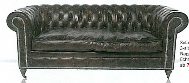
Sofa Oxford, 3-sitzig Nappalon, Echt- oder Vintageleder ab 799,- €